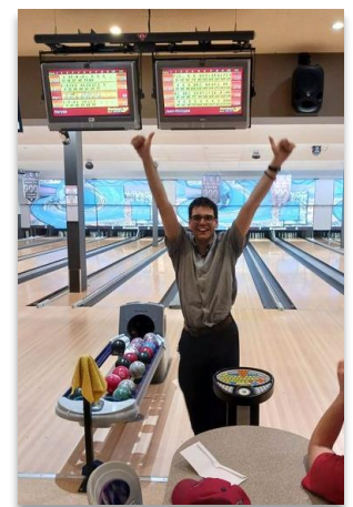
Un trophée est remis aux joueurs réussissant une partie parfaite.